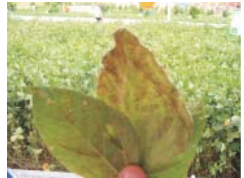
As plantas contaminadas perdem os grãos

O Brasil já registra 638 focos da ferrugem asiática na safra de soja 2005/2006. O número já é maior que o de todo o ano passado (459). O consórcio antiferrugem da EMBRAPA coloca o estado do Mato Grosso do Sul em primeiro na lista, com 218 focos. Em seguida, vem o Paraná com 167 lavouras